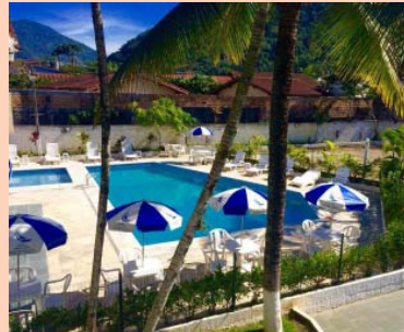
Hotel Costa Azul em Ubatuba, litoral norte de São Paulo, na Praia da Enseada, uma das opções de hospedagem da Sisnaturcard

Seecmatesp fechou nova parceria com a Sisnaturcard. Agora, associados do Sindicato e seus dependentes poderão obter descontos em hotéis, pousadas, chalés e também em opções de lazer, entre cinemas e parques. Para usufruir dos convênios, é necessário se cadastrar pelo site www.sisnaturcard.com.br - Mais informações também pelos telefones: (11) 4330-8996 / 4125-0480 ou através do e-mail: atendimento@sisnaturcard.com.br