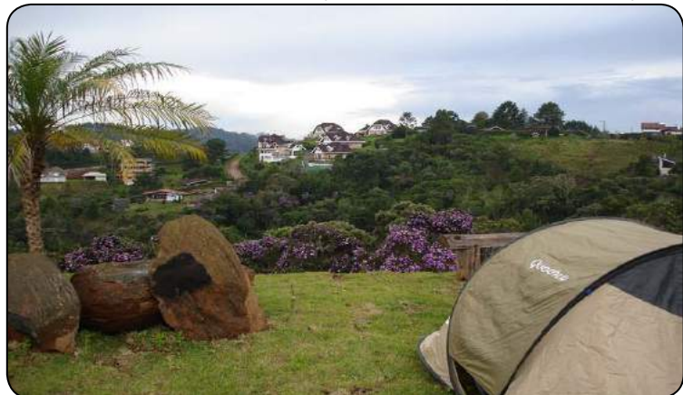
Camping em Campos do Jordão, uma das opções para este inverno.

Desfrutar a natureza é uma boa opção para todas as épocas do ano. Mesmo no inverno, os campistas encontram referências de conforto, lazer e contato com a