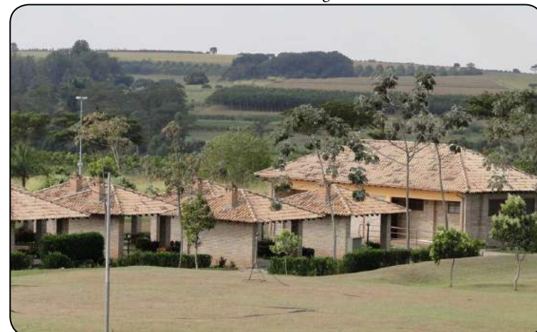
Clube de Campo do Seth São José do Rio Preto em fase final das obras.