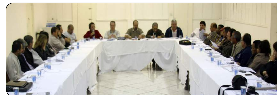
Reunião em Vargem Grande Paulista contou com a presença efetiva dos diretores da FETHESP.

as negociações coletivas. Rogério cobrou mais participação dos sindicatos das negociações quando elas ocorrerem. Ele e os demais dirigentes concordaram que a presença efetiva dos sindicatos e seus respectivos representantes geram "força maior em prol