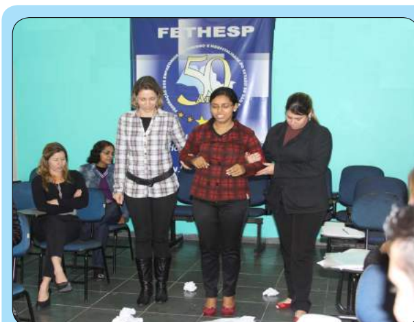
Curso aconteceu em Santo André.