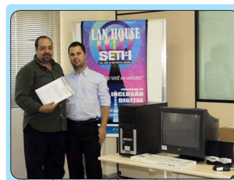
Entrega de Lan House ao Seth São José do Rio Preto, em 2010.