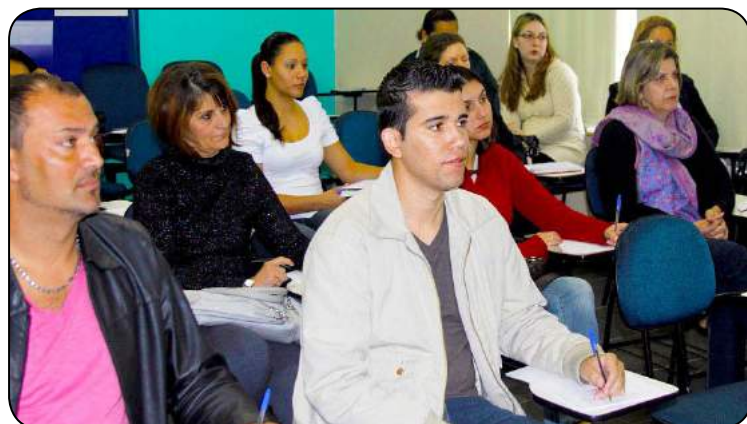
Curso de Medicina e Segurança contou com cerca de 20 participantes.

Nos dias 14 e 15 de junho, o SindBeneficente ofereceu na própria sede, em Santo André, o 6º Curso de Medicina e Segurança do Trabalho.