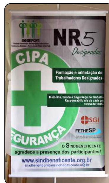
Banner do curso.