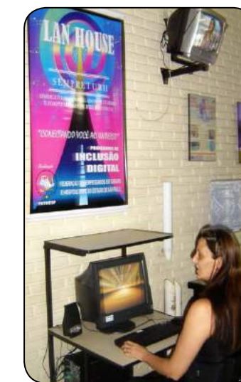
Em 2011, Lan House também foi entregue ao Sempreturh.

dade. Este projeto foi uma grande conquista para a FETHESP como entidade representativa e esperamos poder, a cada dia mais, melhorarmos a nossa representação, atividade e participação na vida dos nossos representados, trazendo novos projetos em favor do trabalhador". □