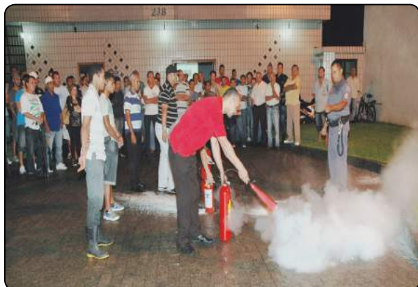
Trabalhadores em Edifícios e Condomínios da Baixada Santista e em Empresas de CVL fazem curso de prevenção de incêndios.

A tentativa ao processo de desenvolvimento por conta do pré-sal e do petróleo na Baixada Santista, o Sindedif (Sind. dos Empregados em Edifícios e Condomínios de Santos, São Vicente e Cubatão, Empregados em Empresas de Compra, Venda, Locação e Administração de Imóveis Resids. e Comercs. de Santos, São Vicente, Praia Grande e Cubatão), filiado à FETHESP, vem se empenhando para promover o aprimoramento profissional da categoria.