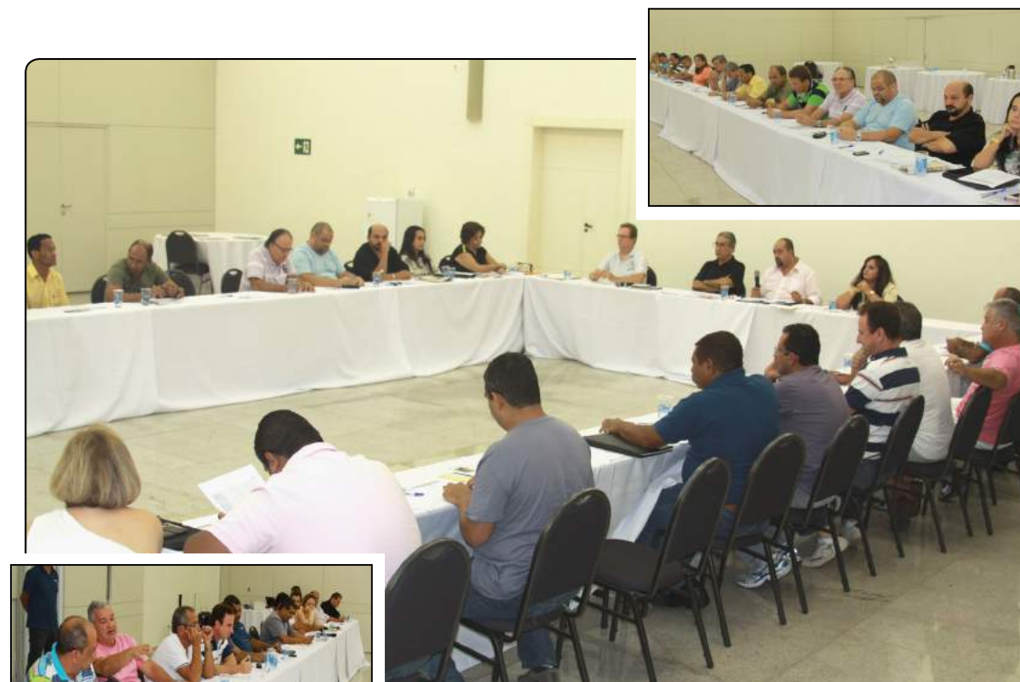
Diretores da FETHESP e presidentes dos sindicatos filiados estiveram reunidos em Piracicaba.

Na reunião foram debatidos assuntos da pasta política, administrativa e sindical da Federação. Um dos destaques discutidos entre os companheiros foi a criação do CONSISMT/FETHESP (Conselho Sindical de Segurança e Medicina no Trabalho, da FETHESP). Trata-se de uma iniciativa da Federação para construir um grupo de estudos, análise e elaboração de projetos na área de Medicina e Segurança no Trabalho voltados para o apoio e orientação