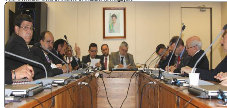
Mesa de Turismo e Hotelaria discute compromisso nacional para o setor nos próximos anos, tendo em vista os eventos esportivos mundiais.