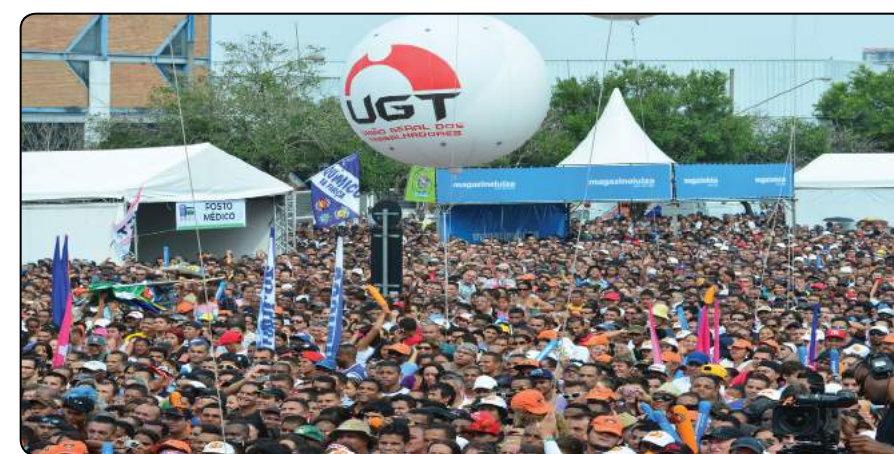
Mais de 1,1 milhão de trabalhadores compareceram na comemoração do Dia do Trabalhador na Praça Campo de Bagatelle, em São Paulo, segundo a UGT.

Shows e manifestações tomaram conta das ruas brasileiras em mais um 1º de Maio, Dia do Trabalhador. Neste ano celebramos os 70 anos de existência da CLT e paramos para refletir sobre essa história de muitas lutas e conquistas dos trabalhadores por condições satisfatórias de trabalho. Foram 70 anos da consolidação de uma gama de leis que tomaram as relações de trabalho mais humanas. Porém, a luta é incessante para que as conquistas atualmente consolidadas um dia não sejam em vão.